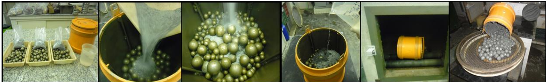
Figura 2. Sequência de operações dos ensaios de moagem.

*Os diâmetros de corpos moedores de reposição de 3 1/2", 3" e 2 1/2" para o moinho industrial referem-se, respectivamente, aos diâmetros indicados como 90 mm, 75 mm e 65 mm.